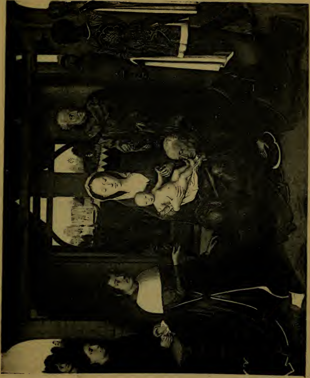
L'Adoration des Mages, panneau central du triptyque.